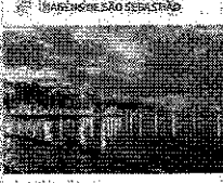
Atualização de dados